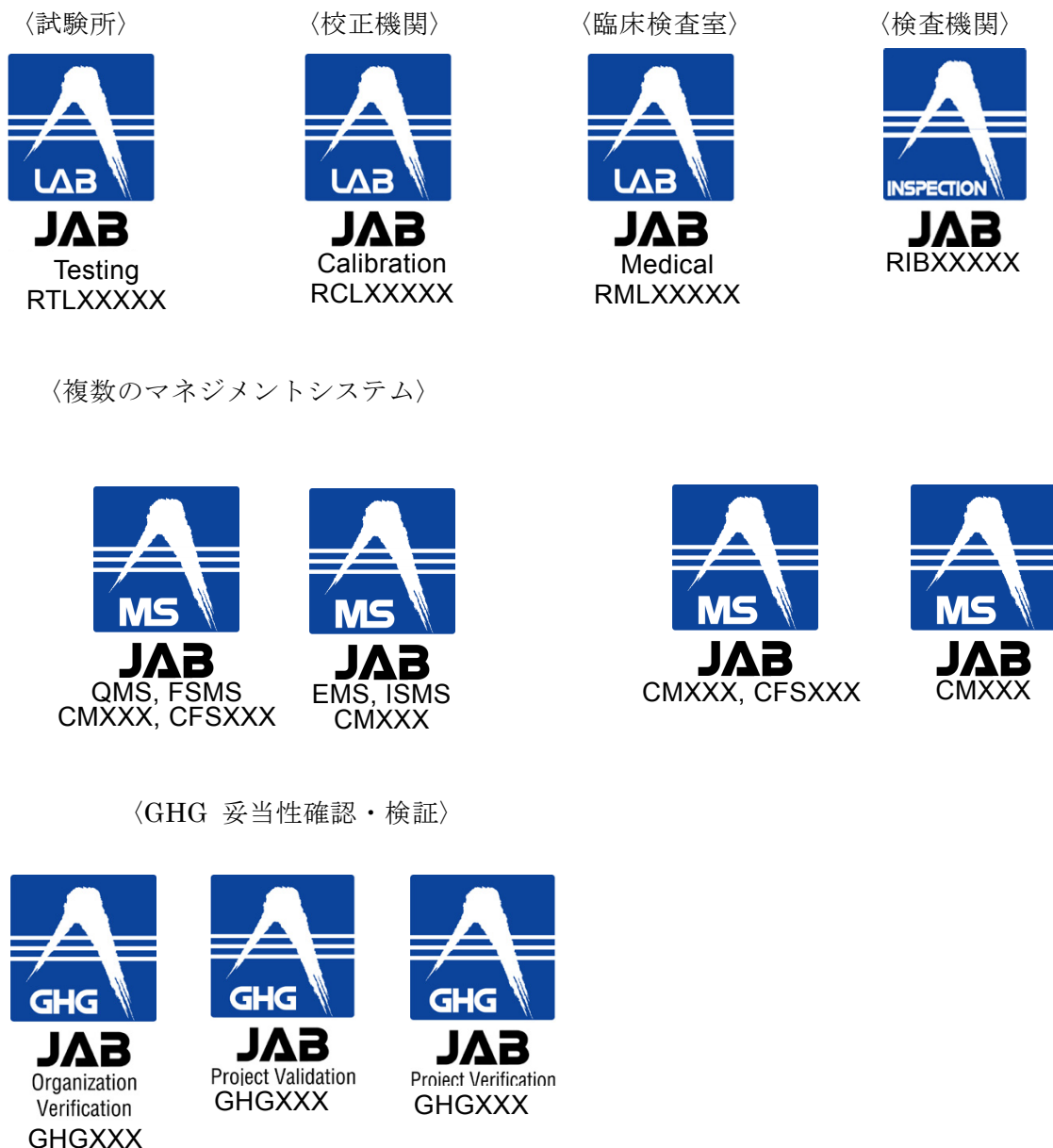
図 3 認定シンボルの表示例